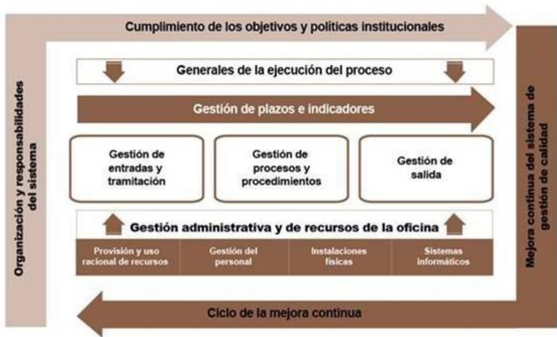
Figura 2. Mapa del sistema de gestión de calidad de la familia de Normas GICAJusticia