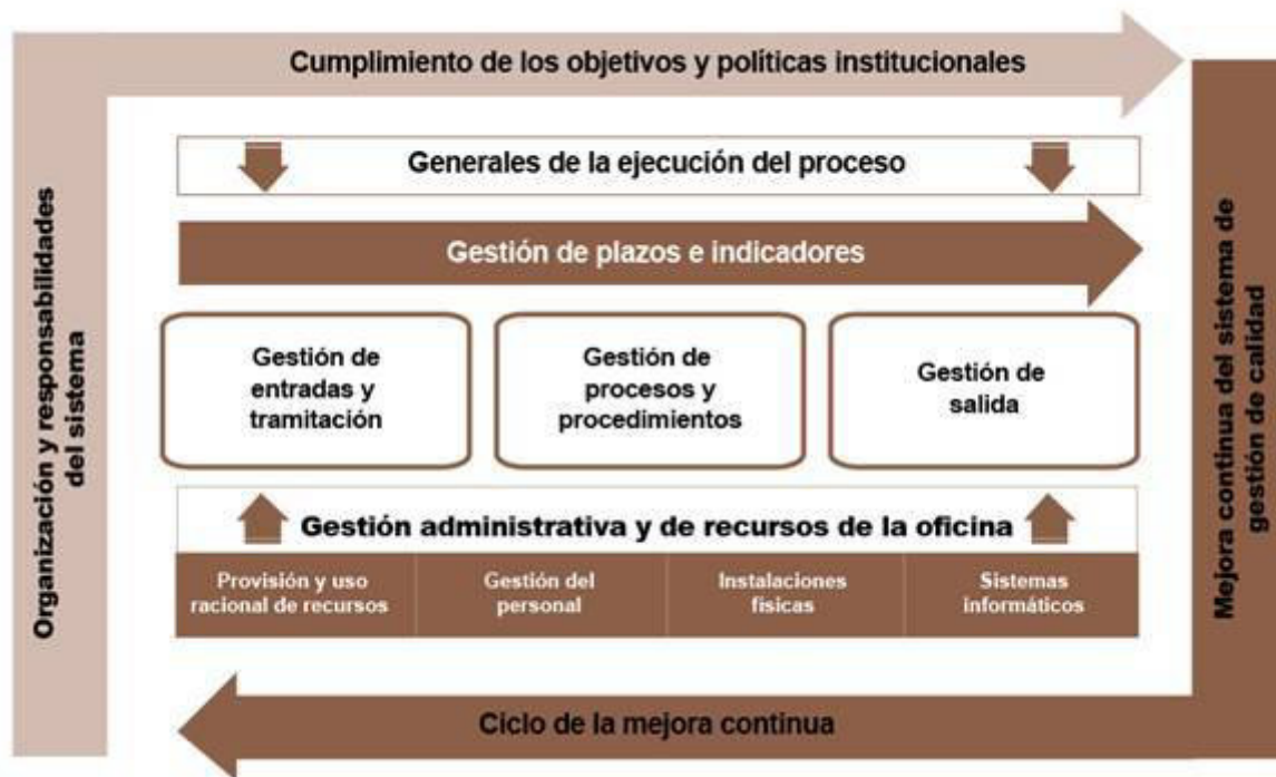
Figura 2. Mapa del sistema de gestión de calidad GICA-Justicia